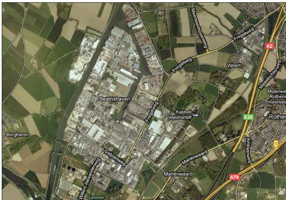
Figuur 1: industrieterrein Beatrixhaven

Het industrieterrein Beatrixhaven is een bedrijventerrein met een oppervlakte van circa 260 hectare, gelegen aan de noordzijde van Maastricht. Op het bedrijventerrein zijn momenteel ongeveer 200 bedrijven uit de sectoren handel, industrie, bouwnijverheid, logistiek en commerciële dienstverlening gevestigd met in totaal circa 7.500 arbeidsplaatsen.