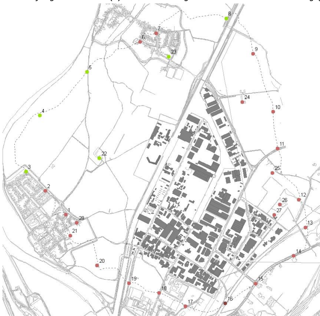
Figuur 3: situatieschets, de ligging van de Beatrixhaven en de zonepunten, evenals een grafische weergave van de overschrijdingen (eindsituatie van actualisatie).

Uit bovenstaande tabel blijkt dat na uitvoering van bovenstaande aanpassingen nog een overschrijding van 1 tot 8 dB(A) resteert. In de figuur 3 wordt de eindsituatie weergegeven.