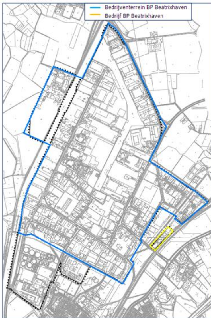
Figuur 5: nieuwe grenzen van het gezoneerd industrieterrein Beatrixhaven

In onderstaand figuur is de 'nieuwe' grens van het industrieterrein weergegeven.